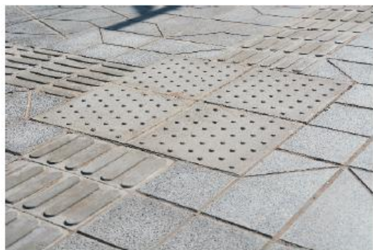
SOLADO DE ALERTA, INTERSECCIÓN DE RECORRIDOS DE GUÍA

Estos materiales garantizarán las indicaciones necesarias para el recorrido seguro de personas no videntes por las veredas.