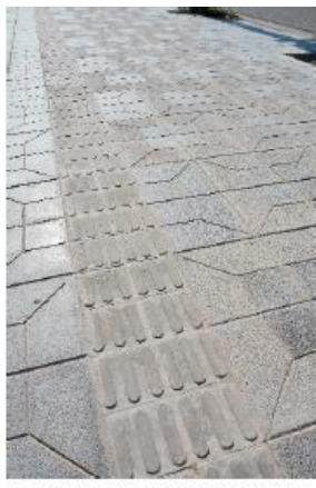
RECORRIDO PARA NO VIDENTES